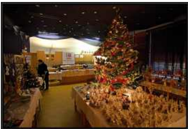
Děkujeme fotografovi - p.Hrstkovi za krásné snímky z Vánočního koncertu a výstavy.