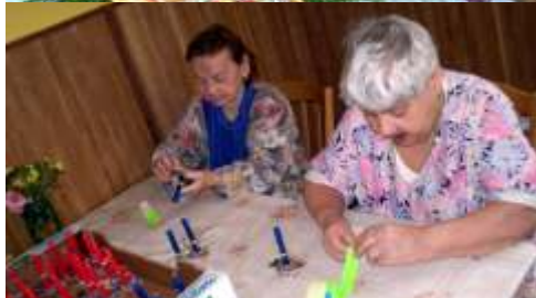
Vánoční dílny na vile