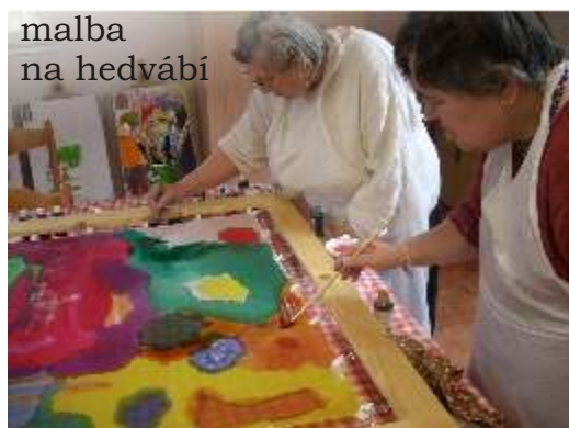
malba na hedvábí