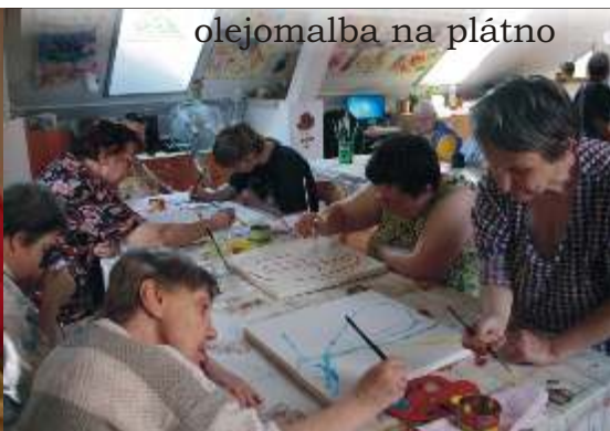
olejomalba na plátno