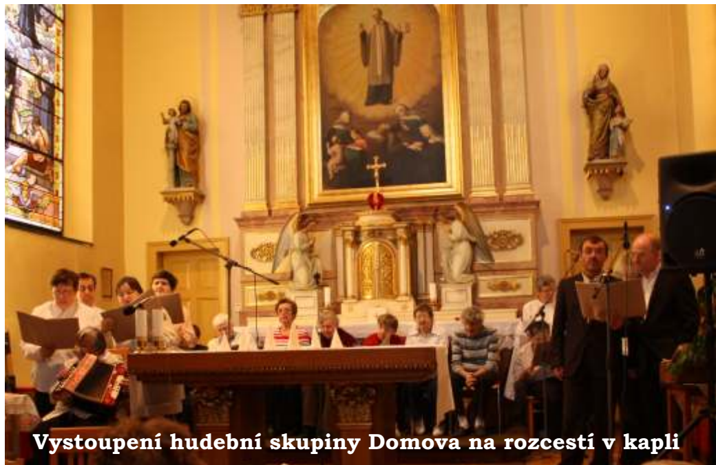
Vystoupení hudební skupiny Domova na rozcestí v kapli